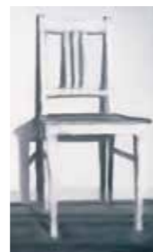
Gerhard Richter: Küchenstuhl, 1965