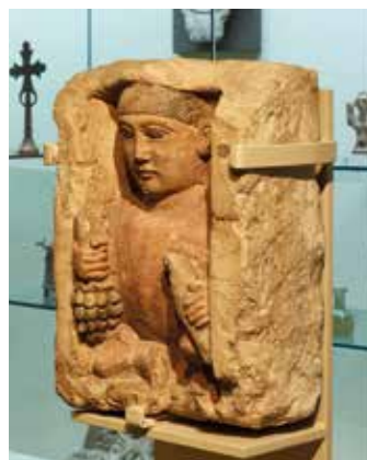
Nischenfigur eines hockenden Knaben, Ägypten, Ende 3. Jahrhundert

Öffnungszeiten: Di - So und feiertags von 11 bis 18 Uhr - Heiligabend und Silvester von 11 bis 14 Uhr Öffentliche Führung: jeden 1. Sonntag im Monat um 15 Uhr Eintritt: 6 €; ermäßigt: 3 €