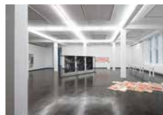
Ausstellungsansicht Kunstpreis junger westen 2021