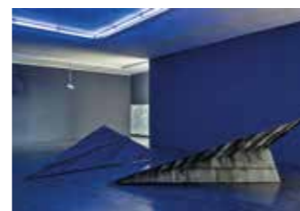
Ausstellungsansicht Flo Kasearu, Foto: Anu Vahtra