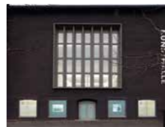
Videokunstnächte, Foto: Alistair Overbruck

Per Kirkeby. Weitere Schwerpunkte sind das deutsche Informel und kinetische Kunst.