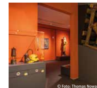
Blick in die Bergbauabteilung

Das stadthistorische Museum RETRO STATION bietet die Möglichkeit, die spannende Geschichte Recklinghausens zu entdecken und sich auf eine Zeitreise zu begeben. Im modern gestalteten Ausstellungsbereich werden zahlreiche Ausstellungsstücke präsentiert, die für die Entwicklung Recklinghausens von Bedeutung sind.