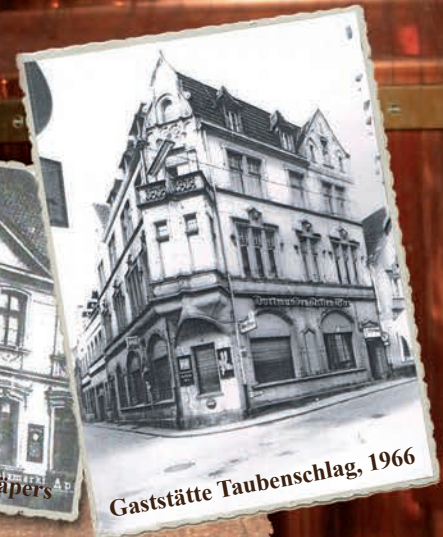
Gaststätte Taubenschlag, 1966