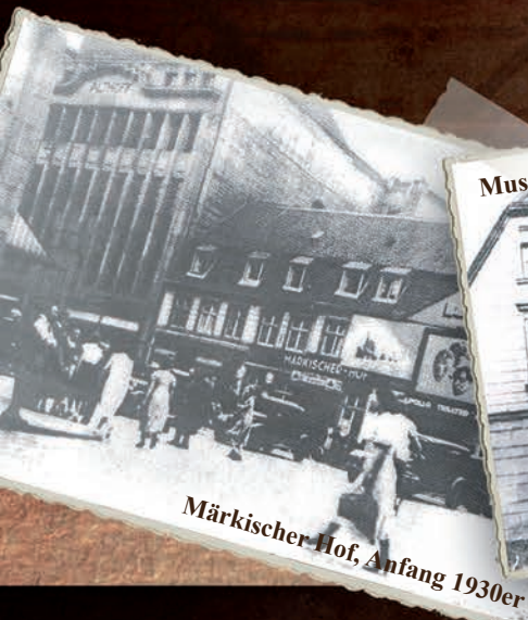
Märkischer Hof, Anfang 1930er